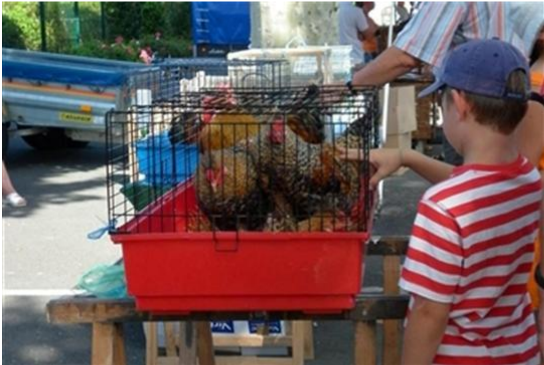
Place du champ de foire, de très nombreux animaux sont en vente, au grand bonheur des enfants .

le 28/08/2011 à 05:00 par Camille Jourdan Vu 137 fois